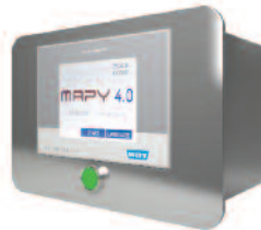
MAPY 4.0 como módulo de inserción de 19"