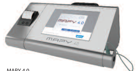
MAPY 4.0 con impresora integrada